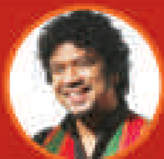
অংগবাহা প্ৰাণন মন্ত্ৰ সংস্কৃত শিল্পী আৰু সুন্দৰ