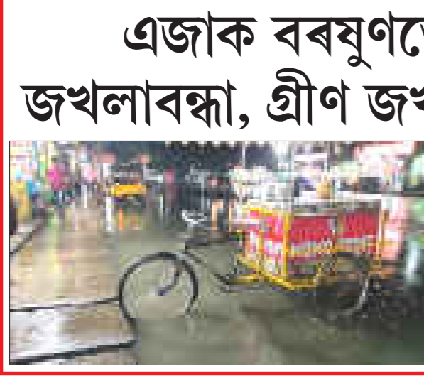
এজাক বৰষুণতে উটি যায় 'ক্লীন জখলাবন্ধা, গ্ৰীণ জখলাবন্ধা'ৰ আভিজাত্য

শিৱসাগৰ, ২৪ জুন : সৰ্বী অসম মটক যুৱ ছাত্ৰ সম্মিলনৰ শিৱসাগৰ জিলা সমিতিৰ উদ্যোগত আজি শিৱসাগৰৰ ঐতিহাসিক শিৱসাগৰ সমুখত সংগঠনটোৱে ১০ দফীয়া দাবীৰ সমৰ্থনত মানৱ শৃংখল কাৰ্যসূচী ৰূপায়ণ কৰে। দুই শতাধিক পুৰুষ-মহিলাই 'আমাক এজ টি প্ৰদান হয় পৃষ্ঠাত চাওক