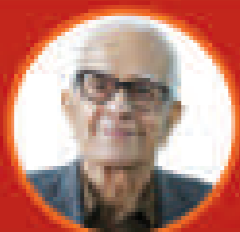
দীৰ্ঘকালীয়া নাৰ্থ চক্ৰৱৰ্তী অসম সাহিত্যিক