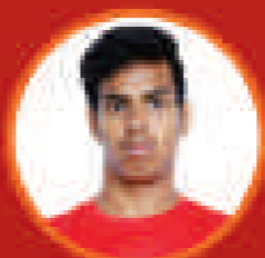
অঞ্জন বৰগোষ্ঠী প্ৰকল্প অফিচৰ সূচিকাৰী প্ৰজেক্ট