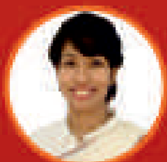
মাডৰীমা বৰগোষ্ঠী অসমীয়া পৰিকল্পনা প্ৰজেক্ট