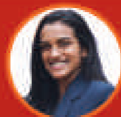
পি ডি সিদ্ধ অসমীয়া পৰিকল্পনা, নেতৃত্ব