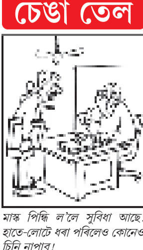
মাক পিন্ধি লৈ সূৰিধা আছে! হাতে-হাতে ধৰা পৰিলেও কোনেও চিনি নাপাৰে!