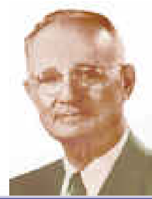
নেপলিয়ন হিল মার্কিন সাহিত্যিক

মনে যি কথাৰ ধাৰণ কৰিব আৰু বিশ্বাস কৰিব পাৰে, সেই কাম ই সম্পূৰ্ণ কৰিবও পাৰে।