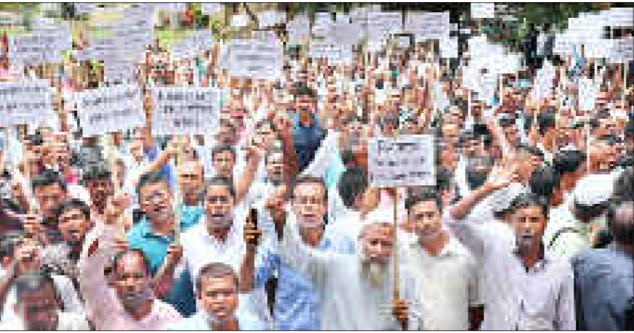
দাবী পূৰণৰ বাবে সদৌ অসম প্ৰাদেশীকৃত টিউটাৰ আৰু কৰ্মচাৰীৰ যুটীয়া মঞ্চৰ প্ৰতিবাদ, মহানগৰীত