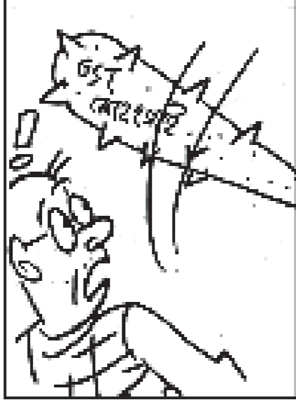
বিচাৰিছে। আৰু! মন্দিৰ-মছজিদৰ যুঁজখনৰ পৰা মুক্তি বিচাৰিছে।

হয় জাহাপনা। মই কেইলো সেয়া মই আখৰে আখৰে পালন কৰিছো। মই কেইলো সেয়া মই আখৰে আখৰে পালন কৰিছো। মই কেইলো সেয়া মই আখৰে আখৰে পালন কৰিছো।