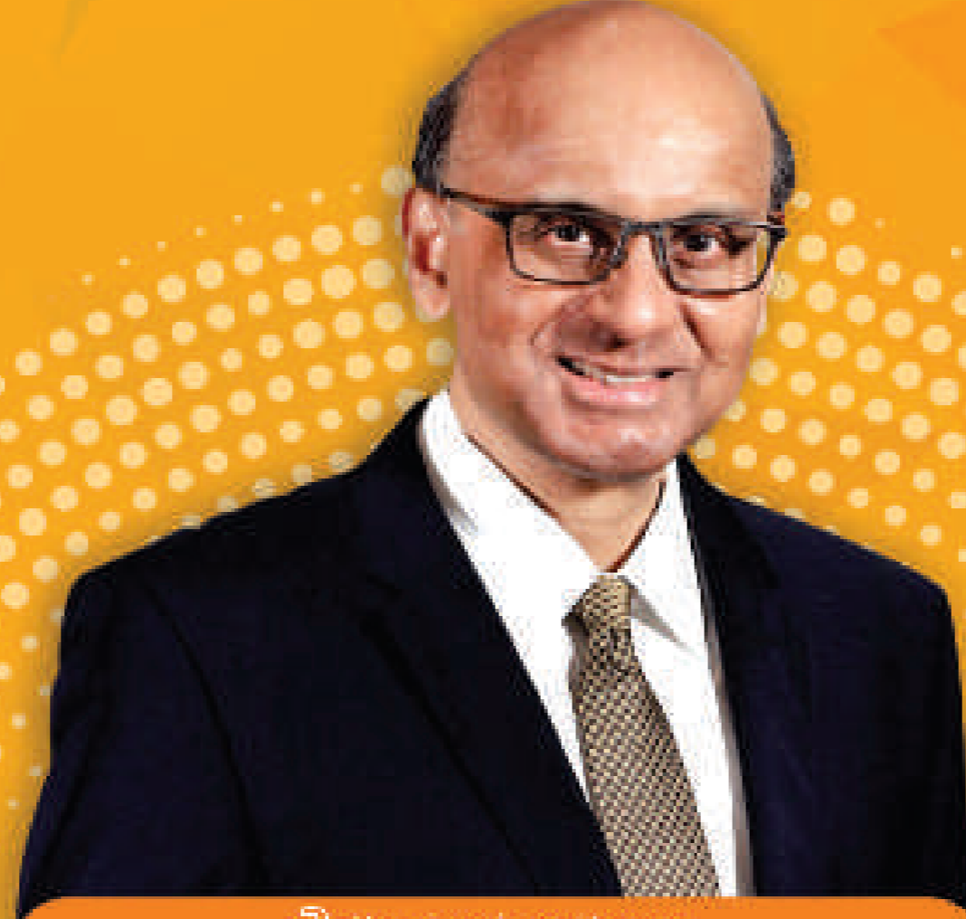
শ্ৰীথাৰমান শনমুগাৰত্নম মাননীয় জ্যেষ্ঠ মন্ত্ৰী, ছিংগাপুৰ

৪ আৰু ৫ জুলাই, ২০২২ তাৰিখে দুদিনীয়া ৰাজ্যিক ভ্ৰমণৰ বাবে অহা