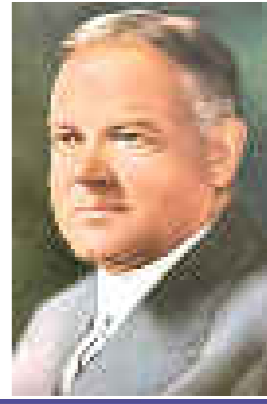
হাৰ্বাৰ্ট লুভাৰ প্ৰাক্তন মাৰ্কিন ৰাষ্ট্ৰপতি

পুঁজিবাদৰ মূল আৰু একমাত্ৰ সমস্যা হৈছে পুঁজিপতিসকল।