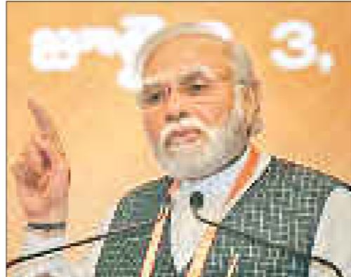
১০ পৃষ্ঠাত চাওক

■ নিউজ বুৰ' হায়দৰাবাদ, ৩ জুলাই : হিন্দু ধৰ্মাৱলম্বী লোকৰ মাজতে আবদ্ধ নাথাকি অন্যান্য সম্প্ৰদায়ৰ মাজলৈ যাবলৈ দলীয় কৰ্মীক আহ্বান জনালে প্ৰধানমন্ত্ৰী নৰেন্দ্ৰ মোদীয়ে। হায়দৰাবাদত অনুষ্ঠিত বিজেপিৰ ৰাষ্ট্ৰীয় কাৰ্যনিৰ্বাহ সমিতিৰ বৈঠকৰ অন্তিম দিনা দলক মানুহৰ মাজলৈ যাবলৈ বাৰ্তা দিলে প্ৰধানমন্ত্ৰীয়ে। আজি তেওঁ ভাষণত হিন্দুসকলৰ উপৰি অন্যান্য বঞ্চিত আৰু নিপীড়িত সম্প্ৰদায়ৰ মানুহৰ সৈতে পোনপটীয়া সংযোগ স্থাপন কৰিবলৈ দলীয় নেতা-কৰ্মীক আহ্বান জনায়। বৈঠকত মোদীয়ে কয়, 'অন্যান্য সম্প্ৰদায়ৰ মাজতো বঞ্চিত, নিপীড়িত মানুহ আছে। আমি কেৱল হিন্দুসকলৰ মাজতে সীমাবদ্ধ হৈ