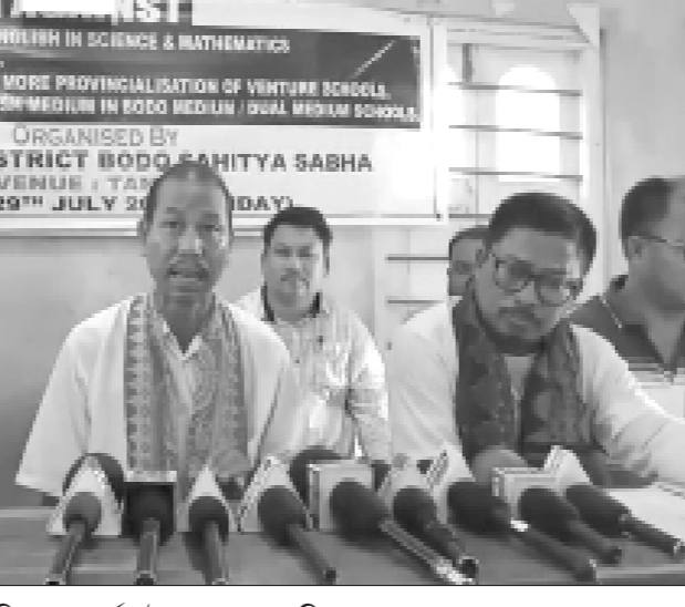
বিদ্যালয় প্ৰাদেশীকৰণ সমন্বয় টোলাত বড়ো সাহিত্য সভাৰ সংবাদমেল।