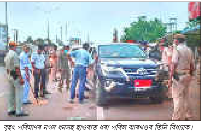
বৃহৎ পৰিমাণৰ নগদ ধনসহ হাওৰাত ধৰা পৰিল ঝাৰখণ্ডৰ তিনি বিধায়ক।

■ নিউজ বুৰ/স্টাফ ৰিপ'ৰ্টাৰ কলকাতা/বাৰ্চী/গুৱাহাটী, ৩১ জুলাই : মহাৰাষ্ট্ৰত শিৱসেনা-কংগ্ৰেছ-এনচিপিৰ মিত্ৰজোঁটৰ চৰকাৰ ওফবোৱাৰ পাছত বিজেপিয়ে এইবাৰ ঝাৰখণ্ডক লক্ষ্য কৰি লোৱাৰ অভিযোগ উঠিছে। কলকাতাৰ হাওৰাত বৃহৎ পৰিমাণৰ নগদ ধনসহ ঝাৰখণ্ডৰ তিনিজন কংগ্ৰেছ বিধায়ক গ্ৰেপ্তাৰ হোৱাৰ ঘটনাৰ আঁত ধৰিয়ে এই অভিযোগ উত্থাপিত হৈছে। উল্লেখ্য যে নগদ ধনসহ আটক তিনি বিধায়কৰ বিৰুদ্ধে ৰজু হোৱা গোচৰ তদন্ত কৰিব পশ্চিমবংগৰ অপৰাধ অনুসন্ধান বিভাগ (চিআইডি)। ইতিমধ্যে কংগ্ৰেছে তিনিওজন বিধায়কক নিলম্বন কৰিছে। ১০ পৃষ্ঠাত চাওক