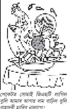
পেকেটত সোমাই জিছট লিপি বুলি আমাৰ আগত দাম বাঢ়িল বুলি বাহাদুৰী মাৰিৰ নালাপে!