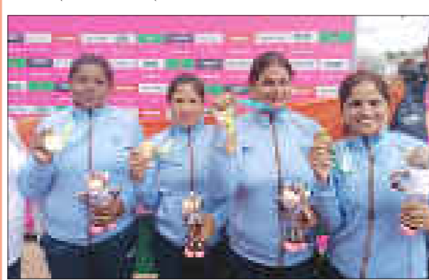
নিউজ যুৱ/অগ্ৰদূত বাৰ্তা নতুন দিল্লী/বৰপেটা/সৰুপথাৰ, ২ আগষ্ট : ৰাৰ্মিংহামত ইতিহাস সৃষ্টি কৰি কমনৱেলথ গেমছৰ লন বলত স্বৰ্ণপদক জয় কৰিলে ভাৰতৰ মহিলা দলে। আজি প্ৰতিযোগিতাৰ মহিলাৰ 'ফ'ৰ্ছ'ৰ ফাইনেলত ভাৰতে দক্ষিণ আফ্ৰিকাৰ ১৭-১০ পইন্টৰ ব্যৱধানত পৰাজিত কৰে।

নয়নমণিৰ কৃতিত্বত আনন্দত চকুলো টুকিলে কণমানি কন্যা তনয়াই ■ ৰাষ্ট্ৰপতি-প্ৰধানমন্ত্ৰী-মুখ্যমন্ত্ৰীৰ অভিনন্দন