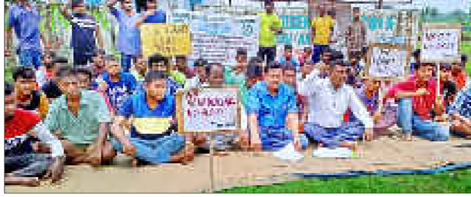
জনজাতিকৰণকে ধৰি বিভিন্ন দাবীত আছাৰ প্ৰতিবাদ, বঙাইগাঁৱত।

বঙাইগাঁও ৰেল ষ্টেছনত অঘটন, নিৰ্মায়মাণ মূখচ পৰি সাত শ্ৰমিক গুৰুতৰভাৱে আহত