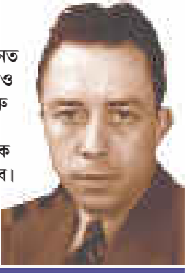
আলবেয়াৰ কেমু ফৰাচী দৰ্শনিক

অহৰহ সুখৰ উৎসৰ সন্ধানত থাকিলে আপুনি কেতিয়াও সুখী হ'ব নোৱাৰিব আৰু জীৱনৰ সংজ্ঞা বিচাৰি থাকিলে কেতিয়াও ইয়াক উপভোগ কৰিব নোৱাৰিব।