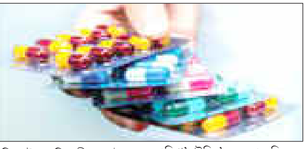
বিক্ৰী পাইছে। বিজ্ঞানীৰ দলটোৱে লগতে কয় যে সম্প্ৰতি ভাৰতত এণ্টিবায়'টিক '৫০০ এম জি দৰৱ সৰ্বাধিক বিক্ৰী হৈছে। বিগত

দৰৱো আছে যিসমূহ বিক্ৰী বা ব্যৱহাৰ কৰাৰ বাবে ড্ৰাগছ কন্ট্ৰ'ল বিভাগে অনুমতি দিয়া নাই। অধ্যয়ন চলোৱা বিশেষজ্ঞৰ দলটোৱে ব্যক্তিগত খণ্ডৰ দৰৱ বিক্ৰীৰ তথ্যপাতী সংগ্ৰহক প্ৰতিষ্ঠান ফাৰ্মা ট্ৰেকৰ পৰা এই তথ্য আহৰণ কৰি দাবী কৰা মতে, ভাৰতীয়ৰ মাজত চিকিৎসকৰ পৰামৰ্শ অবিহনে আৰু নিদান পৰা নোহোৱাকৈ এণ্টিবায়'টিক গ্ৰহণৰ প্ৰৱণতা