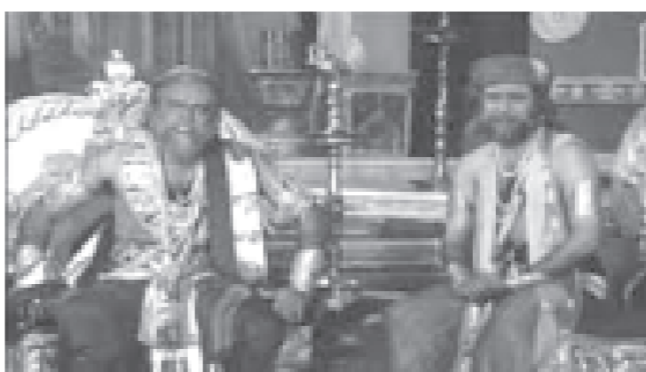
ইতিহাসৰ প্ৰথমগৰাকী কুকুক্ষেত্ৰ ৰথৰ ধাৰাভাষ্যকাৰ সঞ্জয়।

ইপিনে, কেন্দ্ৰীয় চৰকাৰৰ এনে কাৰ্যৰ বিৰুদ্ধে ৰাষ্ট্ৰজুৰি মিশ্ৰিত প্ৰতিক্ৰিয়াৰ সৃষ্টি হৈছে। বিজেপি নেতৃস্থানীয় কেন্দ্ৰীয় চৰকাৰে দেশৰ মুছলমানসকলক দমন আৰু চাপৰ মাজত বাধ্যনাই এই সিদ্ধান্ত গ্ৰহণ কৰা বুলি কেইবোৰ মহলে অভিযোগ কৰিছে। আনহাতে, সংগঠনটোৰ নিষিদ্ধ কৰাৰ সপক্ষে বহু মুছলমান নেতাই মতপোষণ কৰিছে। ইয়াৰ ভিতৰত ইছলামিক লেখক