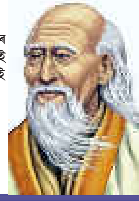
লাও য়ি চীনা দার্শনিক

গুৱাহাটী (০৩৬১) ২২৬১৯২৩ চাৰ্কলেন : ম'বাইল ৯৮৪৮৬৬৮০২৮১ বিজ্ঞাপন : ম'বাইল ৯৮৬৬৮০৯১৭৫ যোৰহাট : (০৩৭৬) ২৩৭১৮৯৫, তেজপুৰ : (০৩৭১২) ২২১৫৫১, ডিব্ৰুগড় : (০৩৭৩) ২৩২৭৮৫৫ হোৱাটছঅপ : ৭৬৩৮০৫৮০৫৪ (সম্পাদনা) agradoot@gmail.com editor.agradoot@gmail.com ■ কাকত নাপালে ফোন কৰক : ৯১০১২-৩৮০০৩