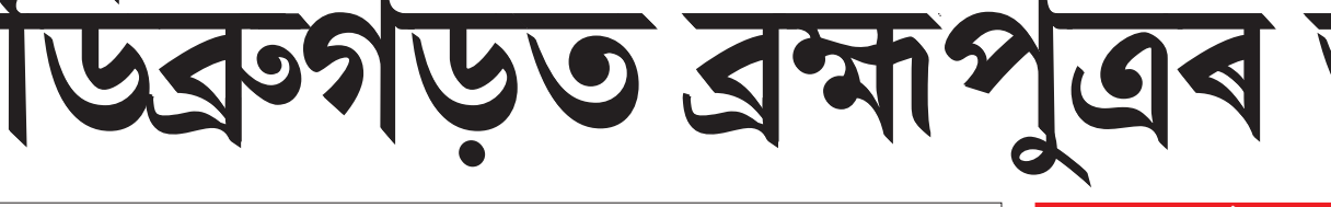
ব্ৰহ্মপুত্ৰই খহাই নিয়া সুৰক্ষা বান্ধ মেৰামতিৰ বাবে স্বেচ্ছাই ওলাই আহিল চাহ শ্ৰমিক, ডিব্ৰুগড়ত মঙলবাৰে।