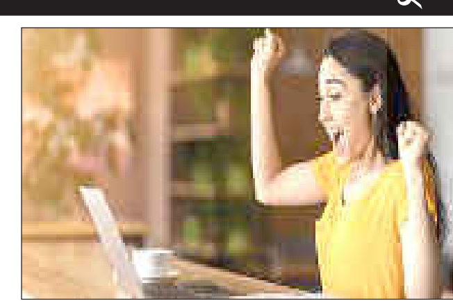
পাৰিৰ। উল্লেখ্য যে প্ৰাৰ্থীয়ে ১২ অক্টোবৰৰ ভিতৰত আবেদন দাখিল কৰিব লাগিব। বয়সৰ সীমা : এইসমূহ পদত নিযুক্তিৰ বাবে ৪০ বছৰ অনূৰ্ধ্ব বয়সৰ প্ৰাৰ্থীয়ে আবেদন দাখিল কৰিব পাৰিব। শিক্ষাগত অৰ্হতা : আবেদনকাৰী চিভিল/মেকানিকেল আদি বিষয়ত বি.ই বা বি.টেক বা এম.ই বা এম.টেক বা এম.এছ চি ডিগ্ৰীধাৰী হ'ব লাগিব। উল্লেখ্য যে

তেল আৰু প্ৰাকৃতিক গেছ আয়োগ (অ'এনজিচিট) লিমিটেডে এছিষ্টেণ্ট এগ্ৰিকাল্টিউটিভ ইঞ্জিনিয়াৰ, কেৰ্মিষ্টৰ দৰে পদত নিযুক্তিৰ বাবে অৰ্হতাধাৰী প্ৰাৰ্থীৰ পৰা আবেদন আহ্বান কৰিছে। এই নিযুক্তি পৰীক্ষাৰ জৰিয়তে অ'এন জি চিয়ে খালী থকা মুঠ ৮৭১ টা পদত প্ৰাৰ্থীক নিয়োগ কৰিব। গোট ২০২২ত সফলতা লাভ কৰা প্ৰাৰ্থীয়ে অ'এন জি চি প্লেজুৰেট ট্ৰেইনিং ভেকেপি ২০২২ অধীনত বৰ্তি হ'বলৈ বিচাৰিলে আৰু অন্যান্য অৰ্হতাধাৰীয়ে recruitment.ongc.co.in ৱেবছাইট ভিজিট কৰি আবেদন দাখিল কৰিব